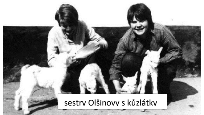
sestry Olšinovy s kůzlátky